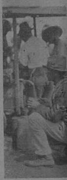
Después de la dura mejor que el delicioso chinchivi.