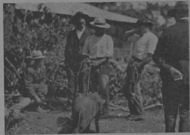
"No así fontof! Usted cre que la chan'ha es robada".