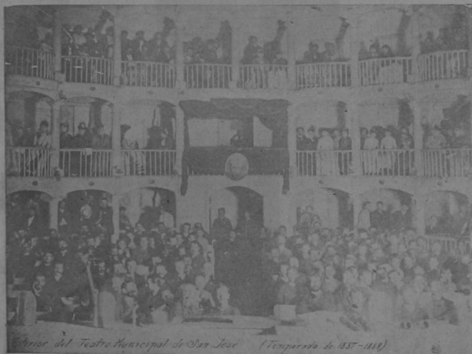
Interior del Teatro Municipal de San José (Temporada de 1887-1888)