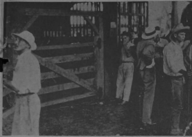
Averigüen cuánto pesaron los novillos.