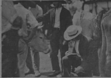
Sacando cuentas para ver a cómo sale el kilo.