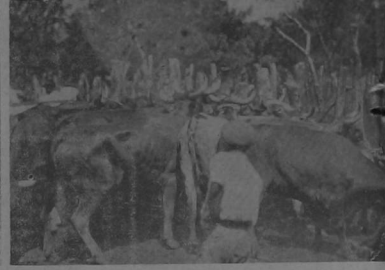
Una partida de ganado, listo para ser vendido al peso, a los comerciantes de la plaza.