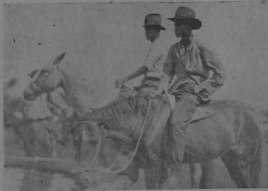
Después de ruda torcaza, y habiendo llegado a la plaza, hay que dar de beber a los galimigos para que tengan buena presencia.