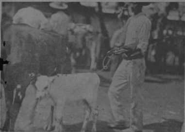
Esperando al deseado comprador