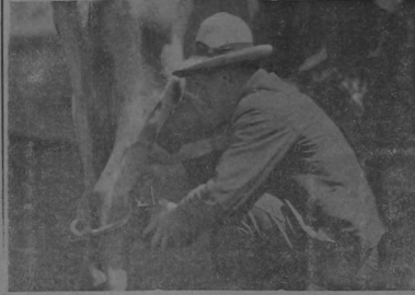
Se ordeña la vaca para que se vea la cantidad de leche que da, aunque hace quizá un mes que no se ordeña.