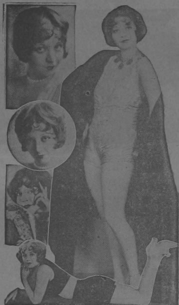
Alice White, estrella de la pantalla, y Dick Grace, conocido actor, habían arreglado todo para contraer matrimonio el cuatro de Julio. Pero su compromiso fue roto y la señorita White declara que ha decidido seguir conservando su independencia a fin de no oponer ningún obstáculo a su profesión filímica.