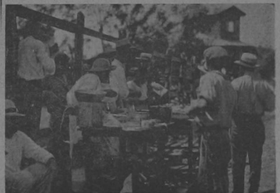
Los clásicos y sabrosos tamales y el imprescindible, mondongo, no han de faltar para hacer las delicias de los comerciantes.