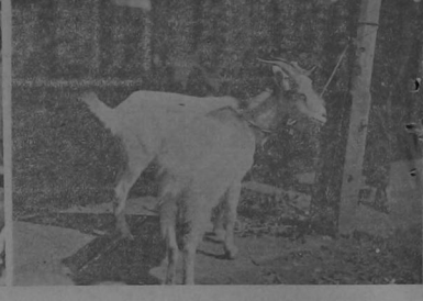
La que siempre tira al monte... esperando a su nuevo dueño.