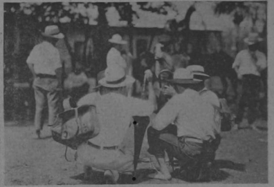
Cambiando impresiones, sentados a la antigua usanza para ver si conviene la vaquilla.