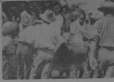
Mercando un ternero.