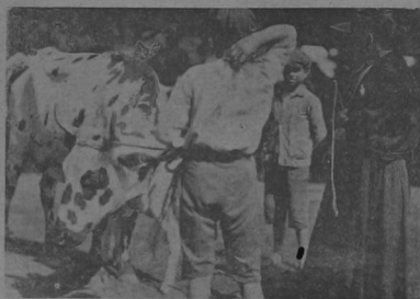
Contemplando la capacidad de la vaquilla pintada, para ver si conviene dar las 3 onzas por ella.