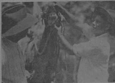
Vista de la cabeza de un cabrito, a la hora de la compra.