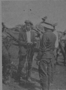
"Palmando" la compra de la yegüilla mostrenca y pastitrotera.