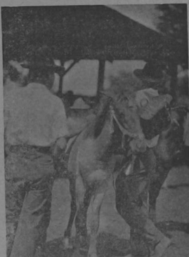
Nadie le hace postura al potrero porque lo ven muy desmedrado, y no saben que es de paso fino y picado.